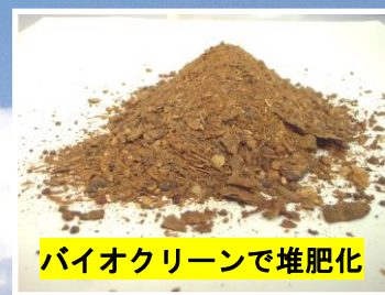
バイオクリーンで堆肥化